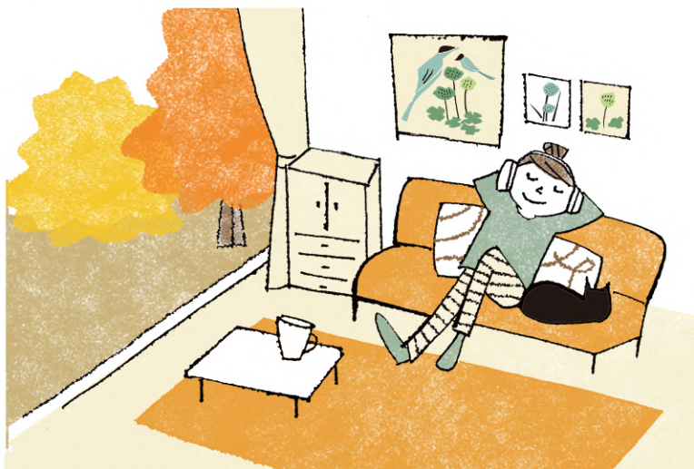
illustration: Ayako Taniyama

1つ目は、自律神経の乱れやストレスによる、体の内側から起こる「じんましん」です。これは、生活の中で無茶や無理を繰り返し、心身ともに疲れた時に出やすく、その後慢性化することもあります。「じんましん」の原因が食べ物ではないかと心配して診察にみえる患者さんが多いのですが、実は食べ物が原因の「じんましん」は意外と少なく、原因の多くは心身の疲労やストレスによるものなのです。